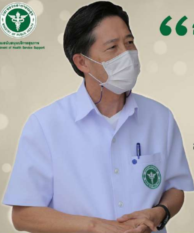
นายแพทย์เรศ รัชนิยรวีวงศ์ อธิบดีกรมสนับสนุนบริการสุขภาพ

ของผู้บริหาร ข้าราชการชั้นผู้ใหญ่ และครอบครัว ในทุกโอกาส ( No gift Policy ) ขอให้แสดงความปรารถนาดีต่อกัน ด้วยบัตรอวยพร สมุดอวยพร อวยพรผ่านสื่อสังคมออนไลน์ หรือทำกิจกรรมจิตอาสาแทน ”